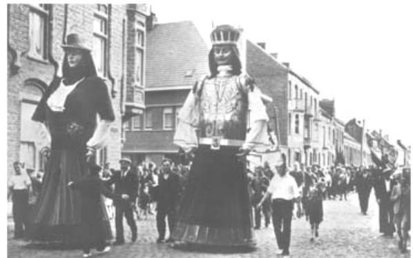
Postkaart van GOLIATH en GRIETJE 1947, deze foto werd genomen te Nieuwpoort hoek Langestraat en de Havenstraat

Deze kaarten werden verkocht, en de opbrengst was bestemd voor de heropbouw van de reus JAN TURPIN II 1963.