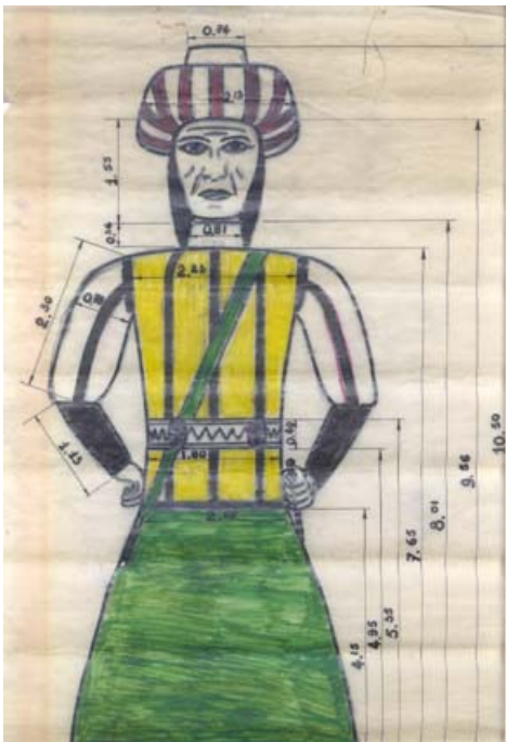
Plan van JAN TURPIN met alle afmetingen daterend van 1 september 1957 (met de oude kledij van JAN TURPIN 1ste reus 1925, werd ingekleurd naar de kledij van JAN TURPIN 2de reus 1963). Naar weten zijn dit de afmetingen van JAN TURPIN II 1963.

Reeds nieuwe plannen voor het bouwen van JAN TURPIN II.