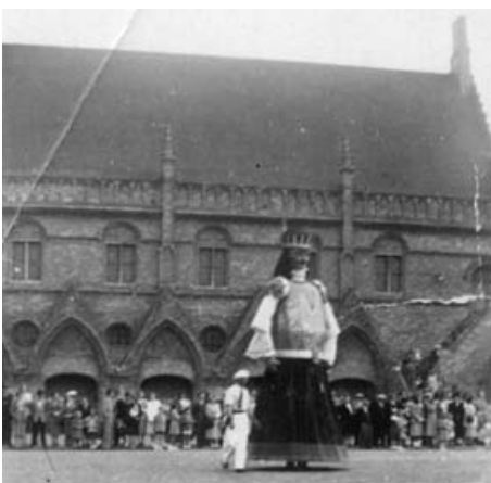
GOLIATH 1947, dansend op het Marktpllein te Nieuwpoort.