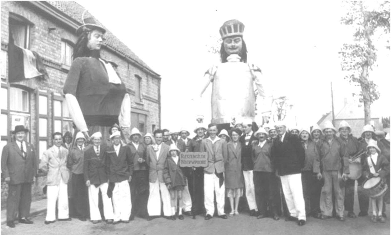
GOLIATH EN GRIETJE 1947, deze foto zou genomen zijn in De Panne ter gelegenheid van een carnavalstoet. De leden van de Reuzengilde zijn op twee manieren aanwezig gezien de ene het gewoon uniform (met witte broek) dragen en andere verkleed zijn in visser.