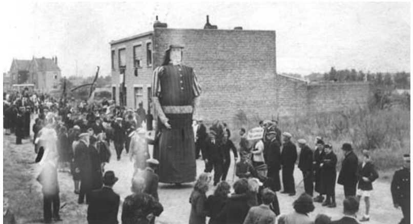
BEVRIJDINGSREUS 1945-1948, tijdens een optocht in de stad gevolgd door een fanfare.

Reus (zonder naam) 1945-1948 Bevrijdingsreus met het bestuur van de Reuzengilde. Werd door 1 man gedragen, was 4 meter hoog en woog 37 kg.