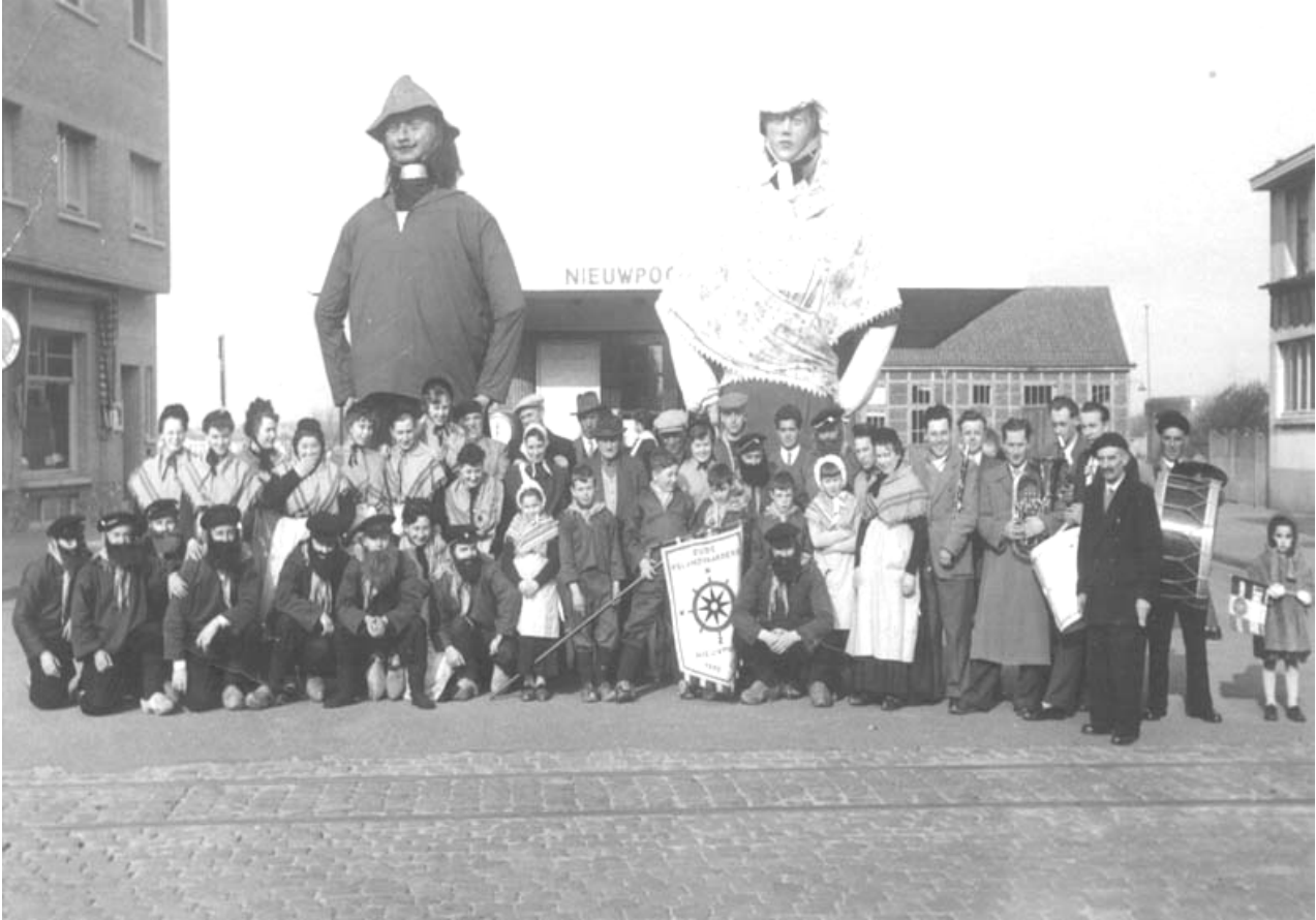
GOLIATH en GRIETJE 1947.

Verkleed in de kledij van een vissersfamilie samen met de folkloregroep "De Nieuwpoortse oude IJslanvaarders", foto genomen te Nieuwpoort-Bad 1953 voor het oude tramsuisje hoek