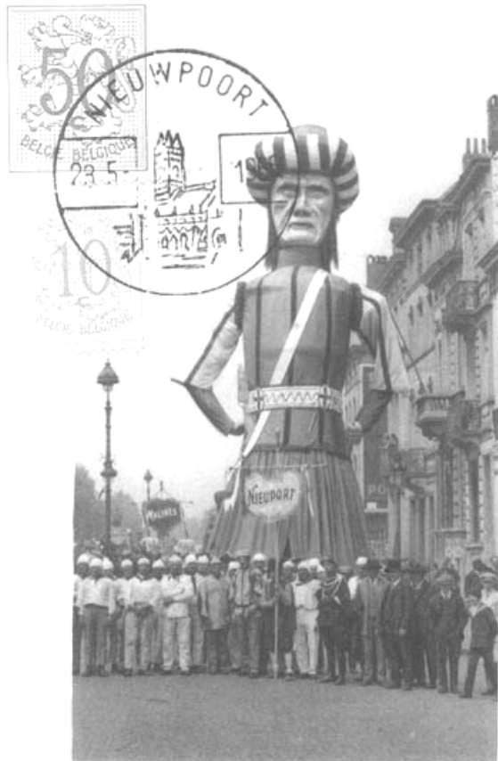
Nieuport. Le géant. Nieuwpoort. De reus.